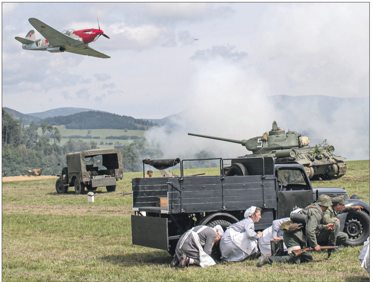
AKCE CIHELNA. Ukážka na vojensko-historické akci Cihelna v Králíkách na Orlickoústecku představila v sobotu těžké osvobozovací boje na Ostravsku na jaře roku 1945. Bitevní scény sehrály na čtyři desítky kusů historické vojenské techniky, originálů i replik, vystoupilo kolem 400 dobově uniformovaných herců z řad klubů vojenské historie a historických vojenských jednotek. (zr)